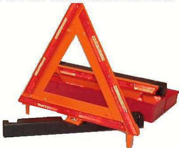
BOÎTE DE TRIANGLES RÉFLECTEURS