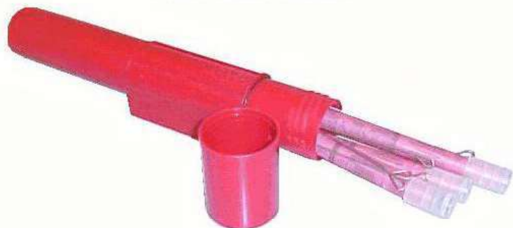
ÉTUI POUR FUSÉES